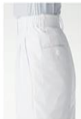
ソータック 両脇ポケット付