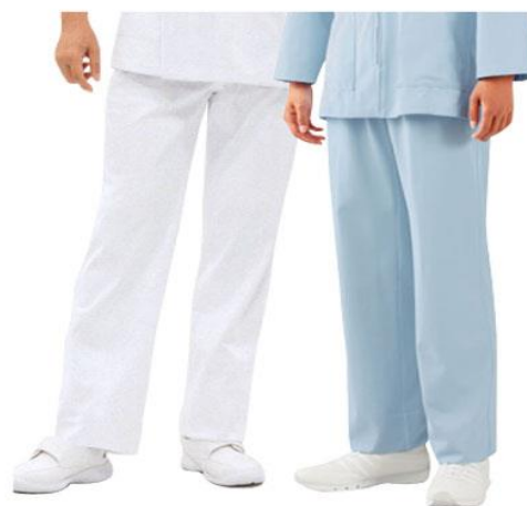
ソータック・両脇