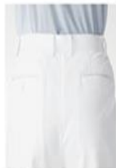
カゴゴム 両後ろポケット付